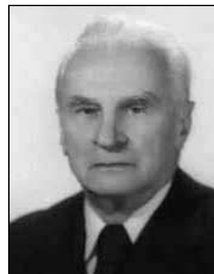
Varaždin, 27.7.1907. – Zagreb, 16.5.1980.