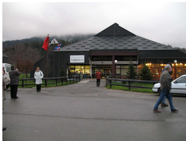
Ogulinske »vještice« i Hrvatski olimpijski centar Bjelolasica

Druga dana Sabora, 25. studenoga 2006., sudionici su uz korisno i ugodno druženje upoznali ogulinski kraj