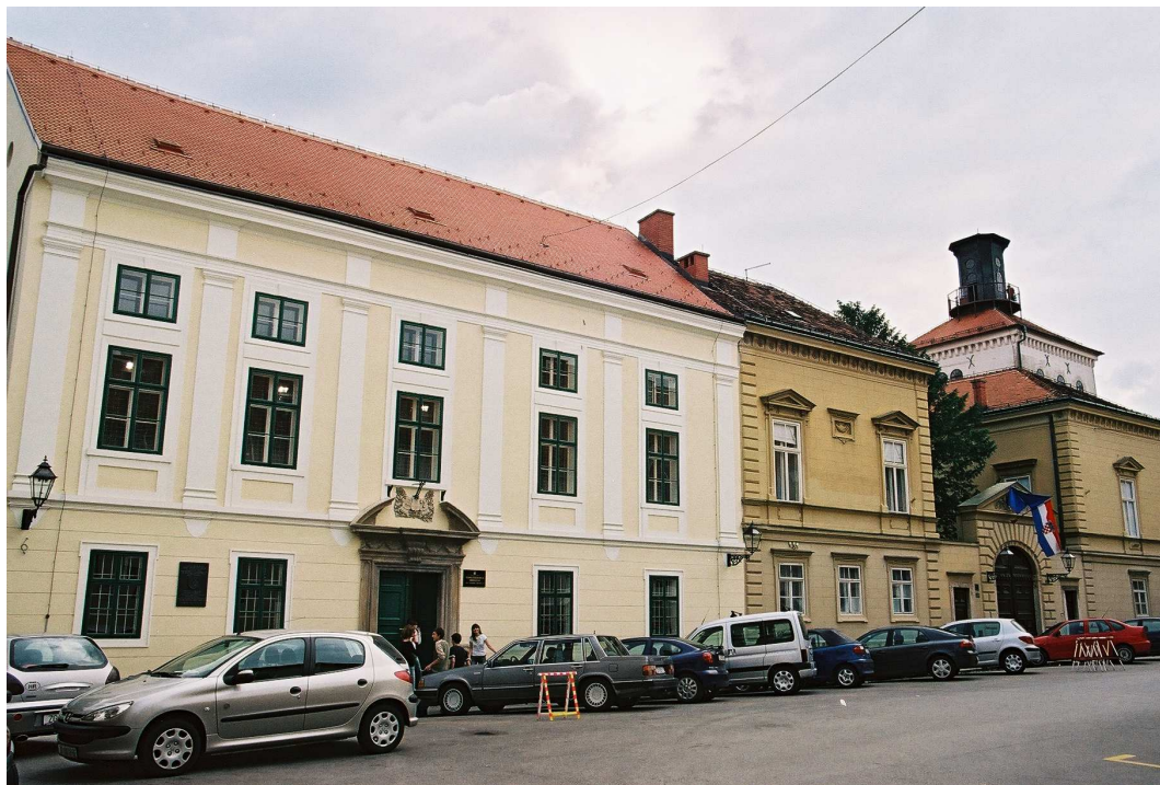
Povijesna zgrada Klasične gimnazije i Akademije odnosno Sveučilišta na Katarinskom trgu 5 u Zagrebu

Među iznimne ovogodišnje događaje svakako treba ubrojiti i proslavu 400. obljetnice osnutka Klasične gimnazije u Zagrebu. Tu su školu osnovali isusovci samo nekoliko mjeseci nakon svojeg dolaska u Zagreb. Od tada Klasična gimnazija djeluje kontinuirano punih 400 godina pa je i danas pohađa oko 600 učenika u 20 razreda. Njezini profesori i učenici pod vodstvom ravnateljice Anđelke Dukat, cijelu su školsku godinu 2006./2007. posvetili obilježavanju obljetnice koja se održavala pod visokim pokroviteljstvom Hrvatskoga sabora, Hrvatske akademije znanosti i umjetnosti te Sveučilišta u Zagrebu.