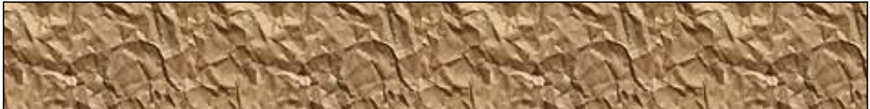
Slika 2. Naslov slike.