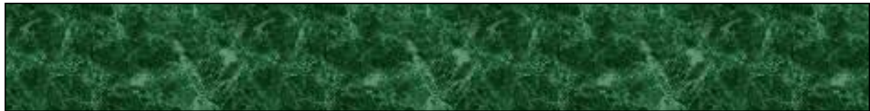
Slika 3. Naslov slike.

Pismo: Times New Roman Veličina: 12 Prored: 1,5 Poravnanje naslova: središnje